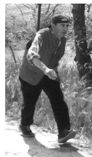
L'Ministr al tir

Sabato 3 aprile si disputerà, lungo via Squar-tagallo, l'ormai sentita sfida di tiro di Bocchetta alla lunga . Organizzata dal Circolo ACLI, la sfida vede ogni anno confrontarsi giocatori di San Silvestro, Sant'Angelo, Filetto, Marzocca e Castellaro. Ed ogni anno aumentano i partecipanti, questo a testimoniare che anche ai più giovani piace questo sport all'aria aperta molto antico. Chissà se quest'anno batteremo il record dei 48 giocatori iscritti della passata edizione? Perciò, capitani delle varie squadre, avvistate i vostri giocatori: ritrovo al circolo alle ore 13 e 30 per il riscaldamento ('na tazza d' caffè) e inizio gara alle ore 14 e 30. Anche stavolta a fine gara porchetta e vino per tutti, più i soliti premi anche con novità che ora non vi posso svelare.